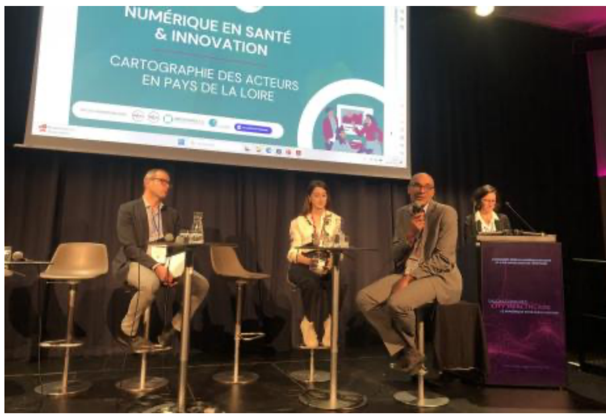
Au salon-congrès City Healthcare, à Nantes.

Comment s'y retrouver dans la jungle des innovations en santé et parmi les acteurs du numérique ? Pour y voir plus clair dans cet écosystème complexe et foisonnant, l'ARS Pays de la Loire et le Groupement régional d'appui au développement de la e-santé (Grades) – en collaboration avec ADN Ouest, le Gérontopôle, Atlanpôle Biotherapies et la CCI Nantes Saint-Nazaire – ont élaboré une cartographie recensant l'ensemble des acteurs de l'innovation du numérique en santé.